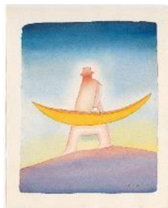
【フォロンの水彩画作品】

上：《大天使》2003年 下：《月世界旅行》1981年 どちらもフォロン財団蔵