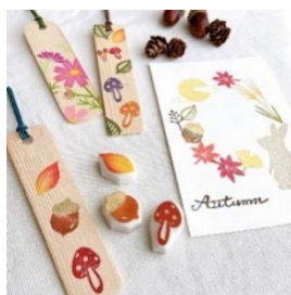
【葉もしくはポストカード】