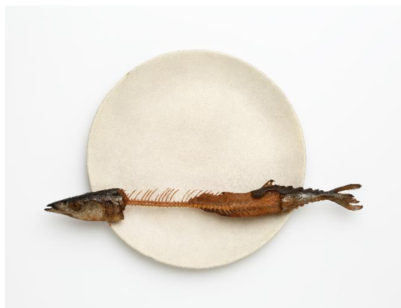
前原冬樹《一刻：皿に秋刀魚》桜、油彩