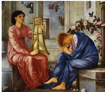
《嘆きの歌》エドワード・バーン＝ジョーンズ 1865-66年 ウィリアム・モリス・ギャラリー Edward Burne-Jones, The Lament, 1865-66, Watercolour and bodycolour, on paper laid down on canvas, 47.5 x 79.5 cm, William Morris Gallery