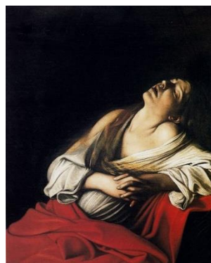
《マグダラのマリア》 1606年 個人蔵