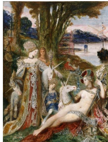
《一角獣》ギュスターヴ・モロー 1885年頃 ギュスターヴ・モロー美術館