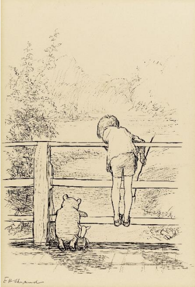
「ながいあいだ、三人はだまって、下を流れてゆく川をながめていました」、 『プー横丁にたった家』第6章、 E.H.シェパード、鉛筆画、1928年、ジェームス・デュボース・コレクション

開催趣旨：『クマのプーさん』は1926年に出版されて以降、50以上の言語に翻訳され、5000万部以上のシリーズ本が出版されています。この展覧会は、著者A.A.ミルンと挿絵を担当したE.H. シェパードの貴重な作品とともに、英国ヴィクトリア・アンド・アルバート博物館をはじめ各国から集めた資料により、世界中で愛される「クマのプーさん」のすべてを紹介する決定版の展覧会です。