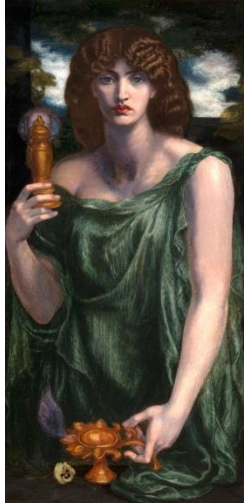
《ムネーモシュネー(記憶の女神)》 ダンテ・ゲイブリエル・ロセッティ 1881年 デラウェア美術館 Dante Gabriel Rossetti, Mnemosyne, 1881, Oil on canvas, 126.4 × 61 cm, Delaware Art Museum, Samuel and Mary R. Bankroft Memorial, 1935

開催趣旨：1848年、ラファエル前派兄弟団は英国美術の刷新をめざし結成されました。画壇から攻撃された彼らを擁護したのは、偉大な風景画家ターナーを支援する美術批評家ラスキンでした。その思想はロセッティやミレイ、バーン＝ジョーンズ、モリスらメンバーの精神的支柱となり、多くの追隨者に引き継がれてゆきます。本展では、ヴィクトリア朝美術に輝かしい軌跡を残し画家たちの功績と、彼らを照らしたラスキンの美学をご紹介します。