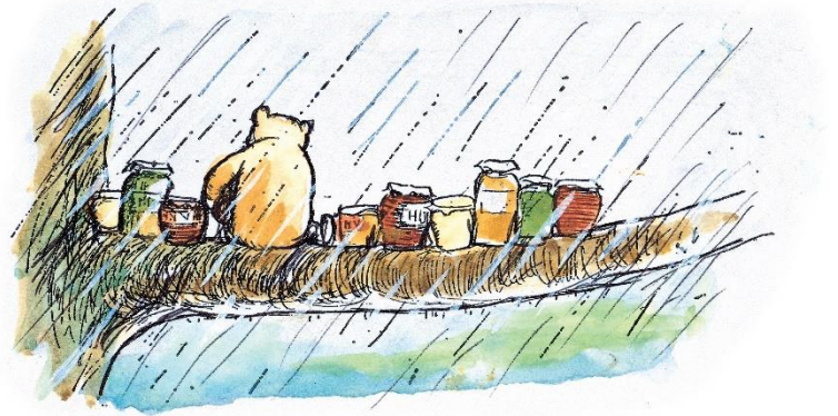
「枝には、ハチミツのつぼが10ならんでいて、そのまんなか、プーが…」、 『クマのプーさん』第9章、E.H.シェパード、ラインブロックプリント・手彩色、 1970年