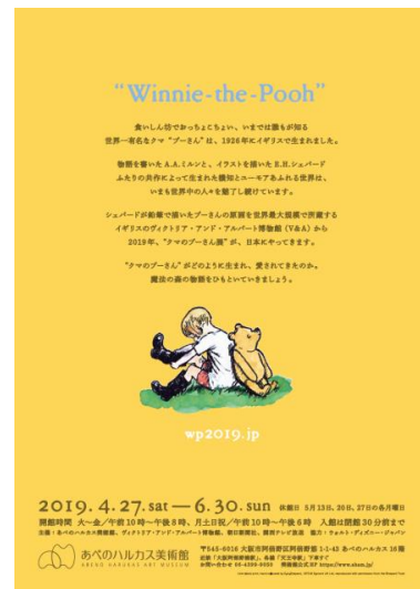
クマのプーさん展 チラシ 裏