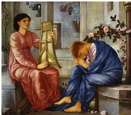
《嘆きの歌》エドワード・バーン＝ジョーンズ 1865-66年 ウィリアム・モリス・ギャラリー Edward Burne-Jones, The Lament, 1865-66, Watercolour and bodycolour, on paper laid down on canvas, 47.5 x 79.5 cm, William Morris Gallery