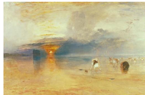
《カレの砂浜 ―― 引き潮時の餌採り》 ジョゼフ・マロード・ウィリアム・ターナー ペリ美術館 J. M. W. Turner, Calais Sands at Low Water: Poissards Collecting Bait, 1830, Oil on canvas, 68.6 x 105.5 cm, Bury Art Museum, Greater Manchester, U.K.