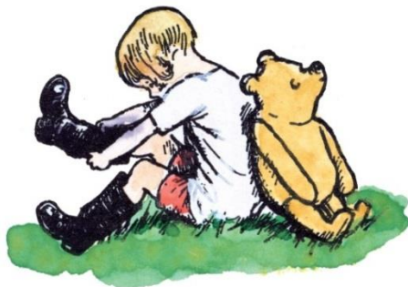
E.H.シェパード、ラインブロックプリント・手彩色、 1970年