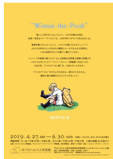
クマのプーさん展 チラシ 裏