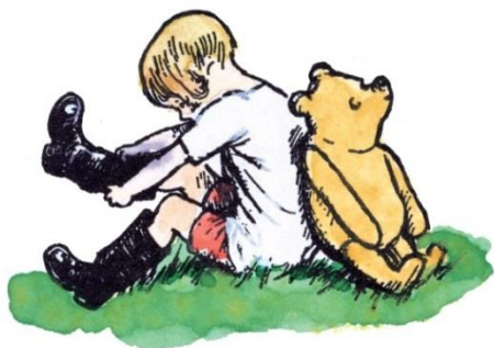
E.H.シェパード、ラインブロックプリント・手彩色、 1970年

開催趣旨：『クマのプーさん』は1926年に出版されて以降、50以上の言語に翻訳され、5000万部以上のシリーズ本が出版されています。この展覧会は、著者A.A.ミルンと挿絵を担当したE.H.シェパードの貴重な作品とともに、英国ヴィクトリア・アンド・アルバート博物館をはじめ各国から集めた資料により、世界中で愛される「クマのプーさん」のすべてを紹介する決定版の展覧会です。