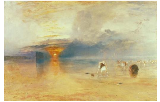
《カレの砂浜 ―― 引き潮時の餌採り》 ジョゼフ・マロード・ウィリアム・ターナー ペリ美術館 J. M. W. Turner, Calais Sands at Low Water: Poissards Collecting Bait, 1830, Oil on canvas, 68.6 x 105.5 cm, Bury Art Museum, Greater Manchester, U.K.