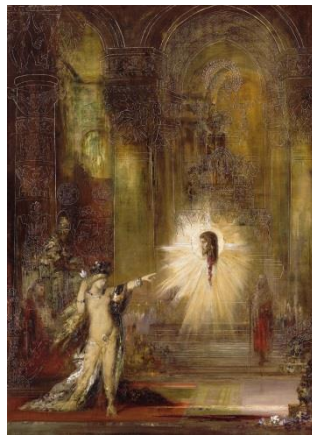
《出現》ギュスターヴ・モロー 1876年頃 ギュスターヴ・モロー美術館