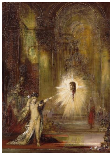
《出現》ギュスターヴ・モロー 1876年頃 ギュスターヴ・モロー美術館

開催趣旨：19世紀末フランスに花開いた象徴主義の巨匠、ギュスターヴ・モロー(1826-1898)は、神話や聖書をテーマにした魅惑的な女性像で知られます。なかでも、新約聖書などに伝わる「サロメ」を描いた作品は、世紀末ファム・ファタル(宿命の女性)のイメージ形成に影響を与えました。本展ではパリのモロー美術館の全面協力のもと、身近な女性たちからファム・ファタルまで、モローの多様な女性像を紹介し、その創造の原点に迫ります。