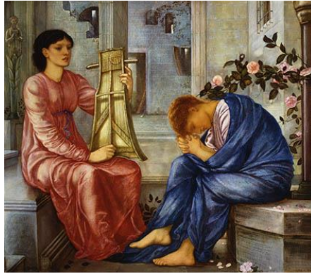
《嘆きの歌》エドワード・バーン＝ジョーンズ 1865-66年 ウィリアム・モリス・ギャラリー Edward Burne-Jones, The Lament, 1865-66, Watercolour and bodycolour, on paper laid down on canvas, 47.5 x 79.5 cm, William Morris Gallery