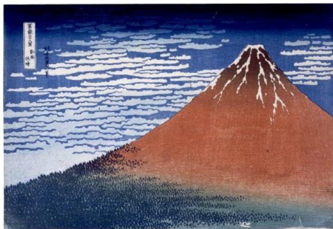
《富嶽三十六景 凱風快晴》横大判錦絵 大英博物館蔵

※プレスリリースに添付している画像データは貸出可能ですのでご希望の方はお問合せください。 また、各展ともに開催2～1ヶ月前を目処に詳細なプレスリリースを皆様のもとへお送りします。