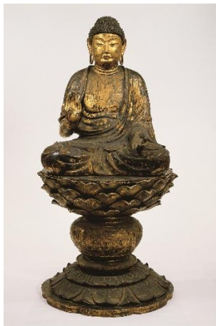
重要文化財《塔本四仏坐像(釈迦如来)》 奈良・西大寺蔵

開催趣旨：本展では西大寺および真言律宗の各寺院に伝わる国宝・重要文化財をはじめ超一級の彫刻・絵画・工芸品など優れた仏教美術を紹介しながら、時代のうねりの中で仏教の進むべき針路を追い求めてきた興正菩薩叡尊ら西大寺一門の僧侶や同寺にかかわった人々の足跡をたどります。