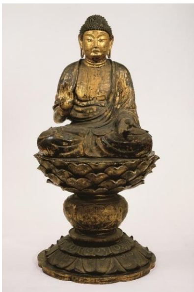
重要文化財 《塔本四仏坐像(釈迦如来)》 奈良・西大寺蔵