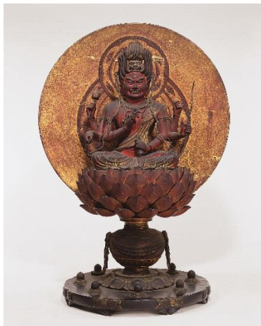
重要文化財《愛染明王坐像》 奈良・西大寺蔵