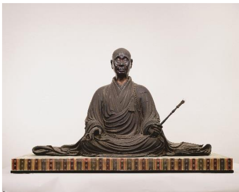
国宝《興正菩薩坐像》 奈良・西大寺蔵