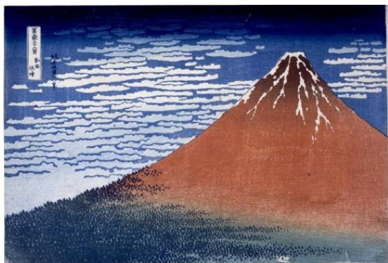
《富嶽三十六景 凱風快晴》横大判錦絵 大英博物館蔵

開催趣旨：葛飾北斎は、浮世絵師でありながら、その枠を超えた絵画界の巨人です。90年の生涯のうち、常に新しいことに挑戦し続け、あらゆる分野で一流を確立した絵師として、今もなお世界的な名声を勝ちえています。北斎の作品の抜きんでた個性、エネルギー、そして高尚さを示すこと、特に晩年の北斎が希求し、絵師として神の世界に至るべく努力した足跡を、見る人に届けることが本展覧会の目的です。