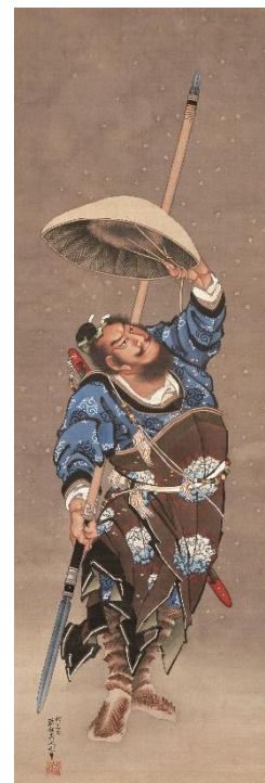
《雪中張飛図》 絹本一幅 氏家浮世絵コレクション蔵