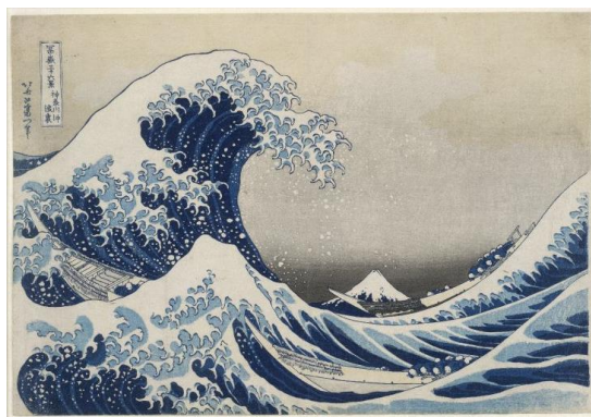
《富嶽三十六景 神奈川沖浪裏》横大判錦絵 大英博物館蔵