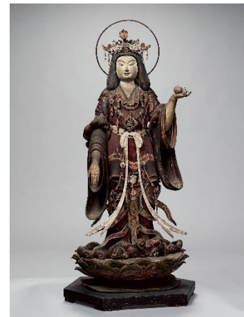
重要文化財《吉祥天立像》 京都・浄瑠璃寺蔵