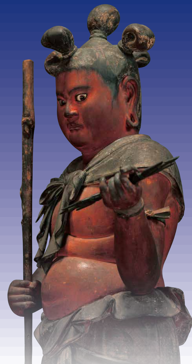
写真：八咫童子像のうち(右)別多童子像・(左)鳥居童子像 複製作 鎌倉時代・12世紀 金剛峯寺