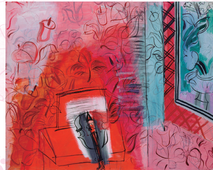
「ヴァイオリンのある静物」(パリのオマージュ) 1952年 油彩、カンヴァス / 国立近代美術館、ポピドール・センター