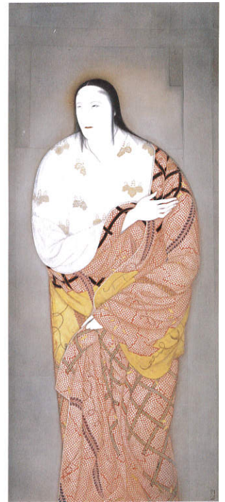
《淀君》 大正9年(1920) 耕三寺博物館