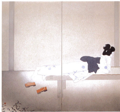
《いとさんこいさん》 昭和11年(1936) 京都市美術館