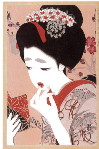
《口紅》 大正6~7年(1917~18)頃 個人蔵

大阪の女性たちを描き続けた画家、北野恒富(1880~1947)。金沢生まれの彼が画家を志して大阪に来たのは17歳の時でした。