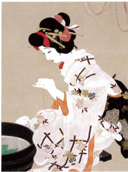
《願いの糸》 大正3年(1914) 木下美術館