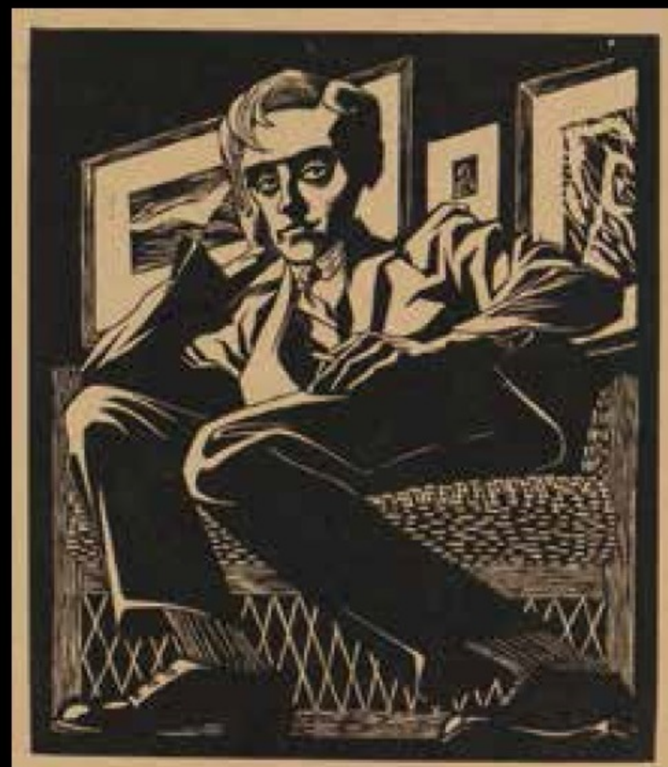
《椅子に座っている自画像》 1920年