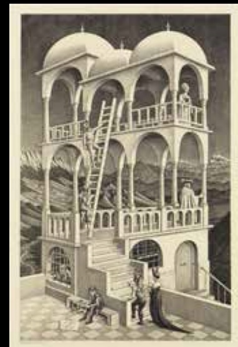
《ベルヴェデーレ》 (物見の塔) 1958年