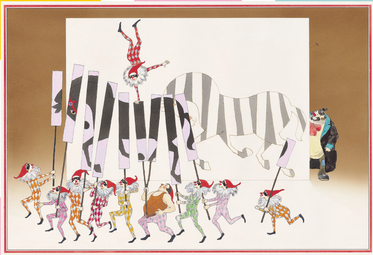
「ふしぎな さーかす」1971年 ©空想工房