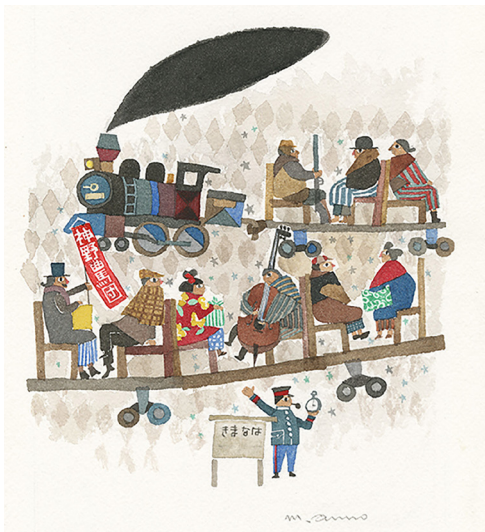
▲「イーハトーボの劇列車(こまつ座 ポスター原画)」1986年