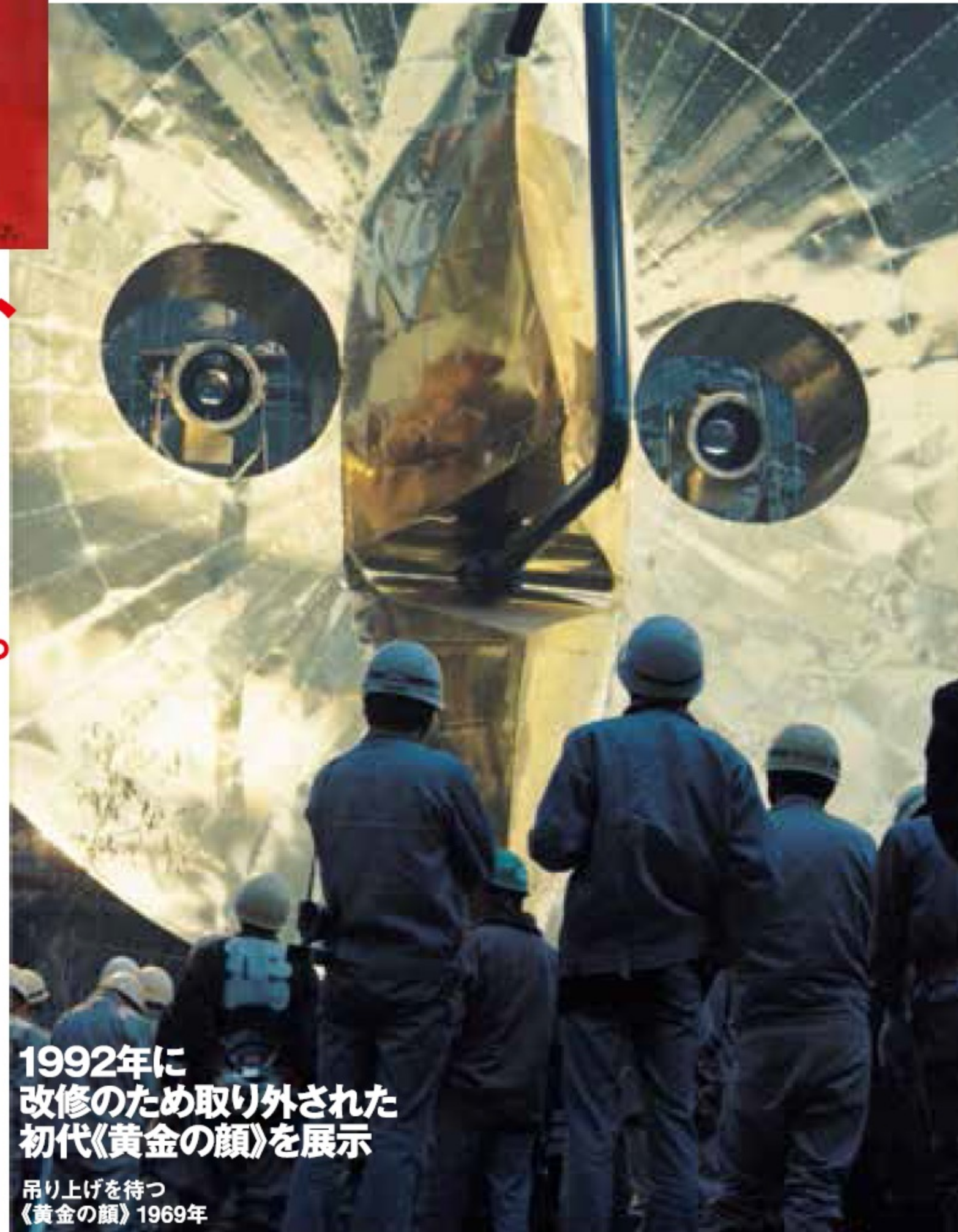
1992年に改修のため取り外された初代《黄金の顔》を展示