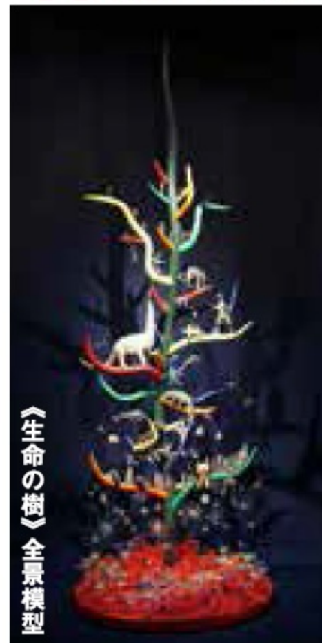
《生命の樹》全景模型