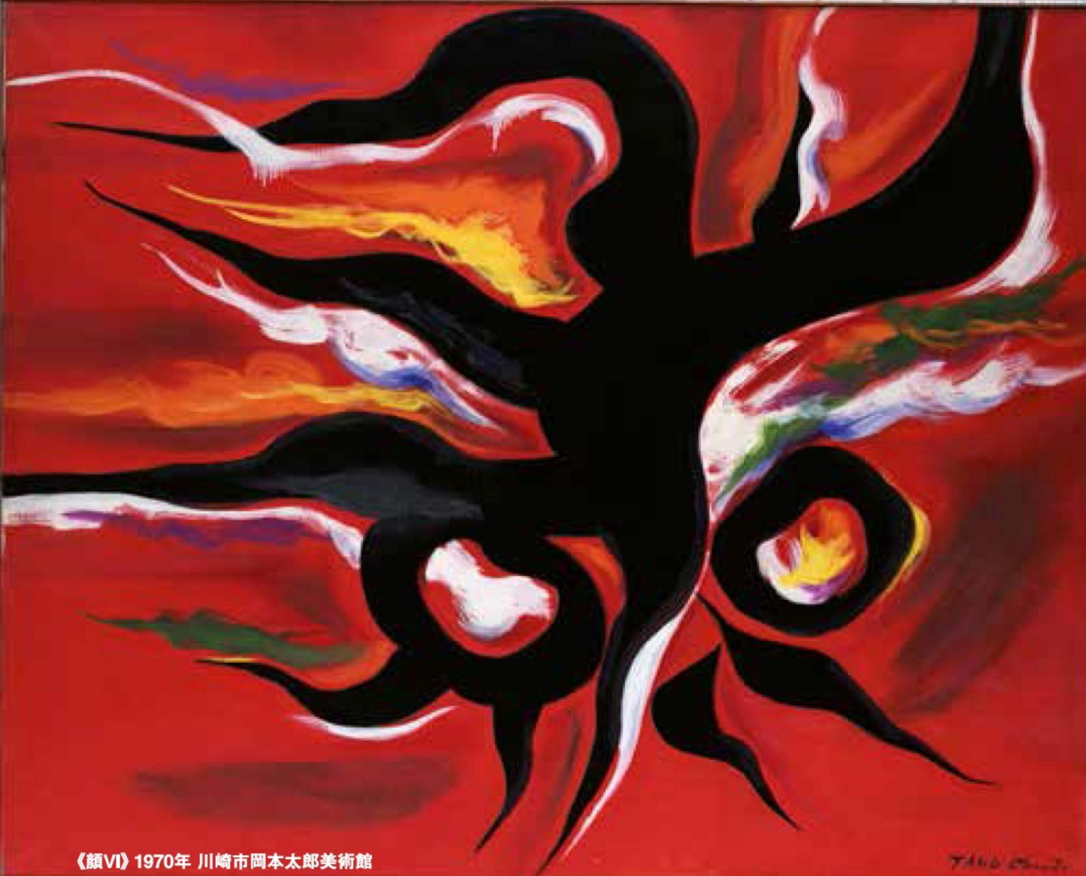
《顔VI》1970年 川崎市岡本太郎美術館

大阪吹田の千里丘陵にそびえ立つ「太陽の塔」。1970(昭和45)年、日本万国博覧会のテーマ館の一部として岡本太郎(1911-1996)が作り上げた異形の塔が、2018年(平成30)3月、48年の時を経てついに息を吹き返しました。本展では、失われた展示空間を3次元で再現。太郎がテーマ館全体の根源を表現した地下展示を追体験します。万博という人類の「祭り」に太郎が問いかけたものの根源とは?「太陽の塔」が内包するものとは?その構想段階から完成、さらには再生事業までを網羅。「太陽の塔」に関連する作品と精巧な模型に加え映像や音響など多彩なメディアを駆使し、岡本太郎の感性を大きなスケールで体感する展覧会です。